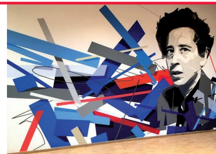
Wandarbeit im Hannah Arendt-Raum der Landesvertretung, © TAPE THAT

Generalitat de Catalunya Regierung von Katalonien