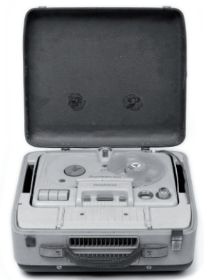
Aufnahmegerät von Walter Kempowski