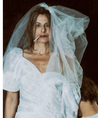
„Die Freiheit einer Frau“ © Marie-Luise Manthei

Siebzehn Frauen zwischen 39 und 91 Jahren mit ganz unterschiedlichen geografischen und sozialen Hintergründen erzählen in „Die Freiheit einer Frau“ von ihren Erfahrungen als Mutter. Die Reflexionen der Interviewten werden von Schauspielerinnen Marion Bordat aus Braunschweig nachempfunden. So zählt nur das Erzählte und nicht das Äußere. Im Vielklang der Installation lassen sich gesellschaftliche Muster erkennen, aber auch ganz individuelle Auffassungen von Mutterschaft entdecken.