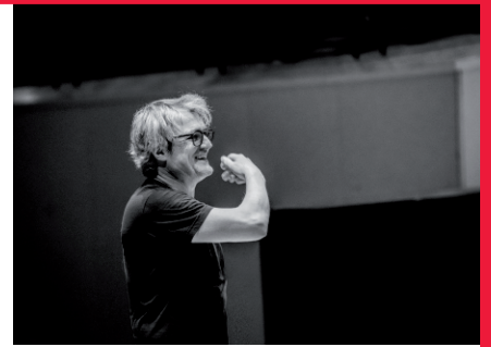
Ingo Metzmacher