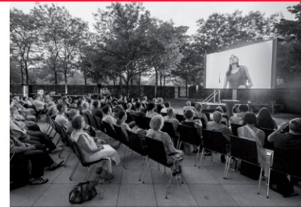
Freiluftkino 2024

Bewegte Bilder in bewegten Zeiten. Aktuell ist auch in den Plots der neuen Produktionen vieles im Fluss: Filme loten die sich wandelnden Generations- und Gesellschaftsverhältnisse aus, Figuren suchen nach neuen Wegen. Gemeinsam mit der nordmedia und dem Braunschweig International Film Festival bringen wir diese neuen Geschichten in den Garten und auf die große Freiluftleinwand.